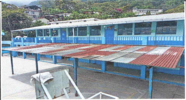
Foto 2: Sustitución de capote de lámina para lámina troquelada.Instalación de canal PVC