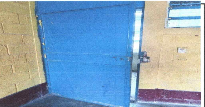
Foto 6: Mantenimiento a estructura (lijado, cambio de tubo, cepillado, sujeciones, aplicación de pintura.

Observación: Si es necesario se pueden agregar hojas adicionales y actualizar el número de hojas.