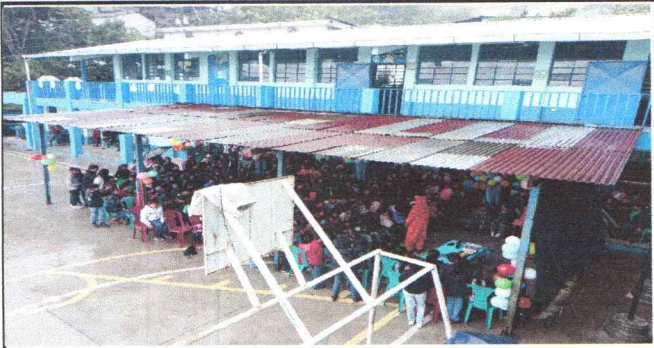
Foto 1: Sustitución de lámina, por lámina troquelada aluzinc calibre 26